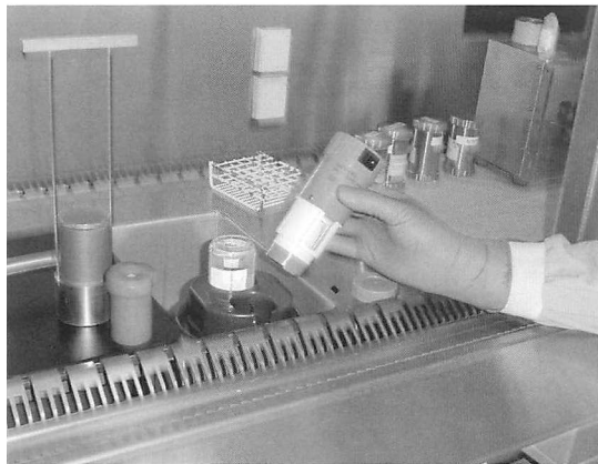
Figuur 1: 99 Mo/ 99m Tc generatorkop met rechts de houder (met afscherming) met de elutieflacon en links de Mo-doorbraakset.