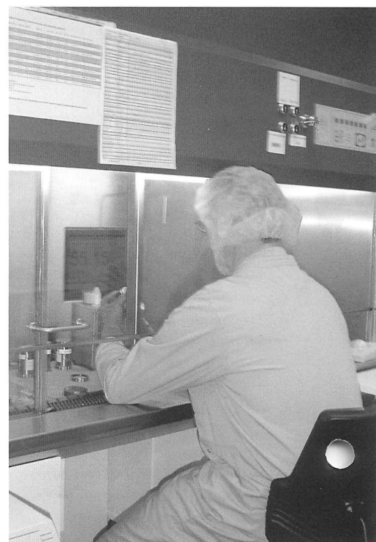
Figuur 3: een met lood afgeschermd laminaire downflowkast waarin de radiofarmaca worden bereid.

Het spreekt voor zich dat de blootstelling toeneemt met de activiteit